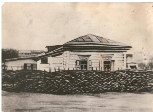
Родной дом Фатиха Карима

Каримов Фатих Ахметвалеевич родился 9 января 1909 года в селе Аитово Илькульминской волости Белебеевского уезда Уфимской губернии (ныне Бижбулякский район Республики Башкортостан) в семье муллы. Начальное образование получил в родной деревне. В 1922 году поступил на подготовительные курсы при педтехникуме в г. Белебее.