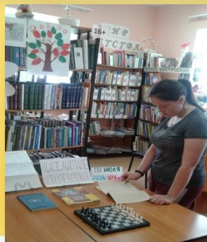
Книжная выкладка «Шахматное королевство»