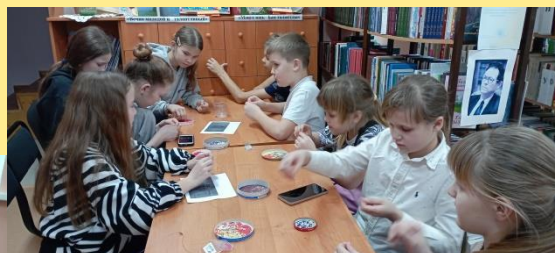
«Божья коровка» - мастер - класс