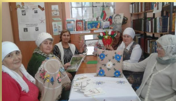
«Мир наших увлечений»