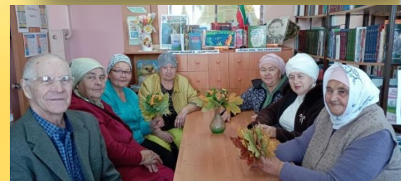
«Розы из кленовых листьев» - мастер – класс