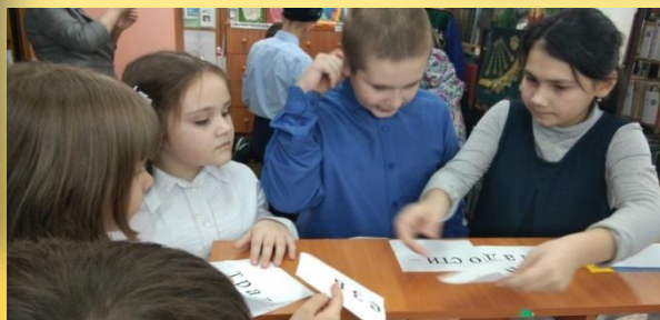
«Кладезь мудрости – народные традиции»- литературный квест