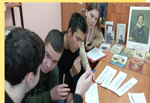
«Литературный мир А.С. Пушкина» -литературный квест