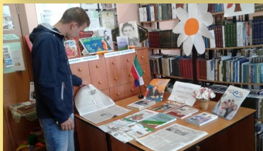
Иллюстрированная выставка периодических изданий «Татарстан – минем туган»