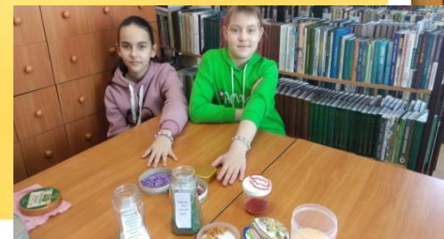
Браслет «Весенняя фантазия» -