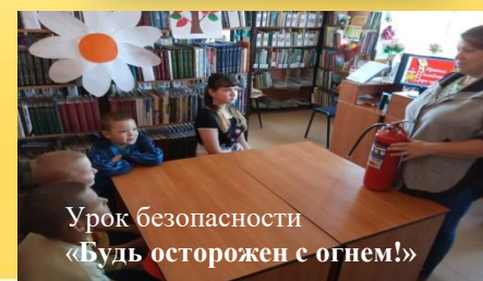
Урок безопасности «Будь осторожен с огнем!»