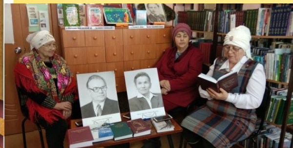
«Две судьбы татарской литературы» - арт - встреча