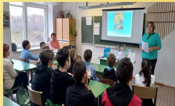
«Он – наш земляк, он – наша гордость!» - устный журнал