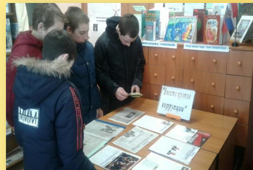
Информационная минутка на тему «Вместе против коррупции»