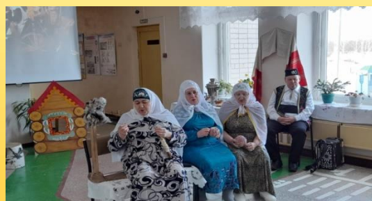
«Татар халык йолалары» - фольклорно – музыкальный вечер