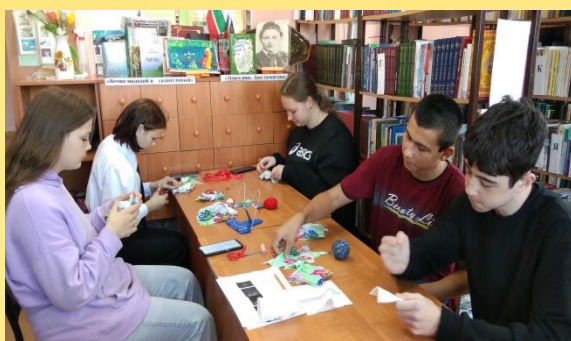
«Славянские куклы-обереги и их значение» -мастер-класс