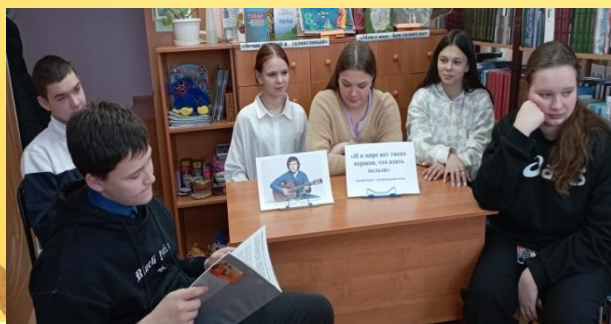
«И в мире нет таких вершин, что взять нельзя» -литературно – музыкальный вечер