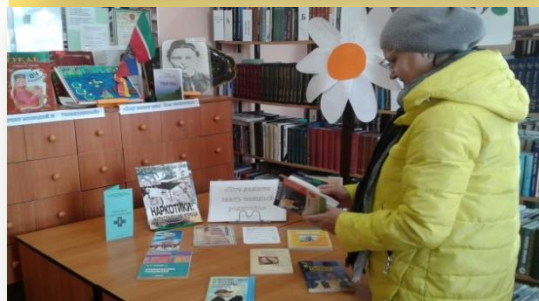
«Это должен знать каждый родитель»