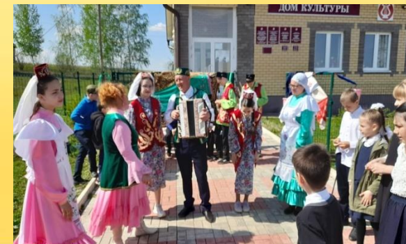
«Алларын да алырбыз...» - праздник детской обрядовой песни