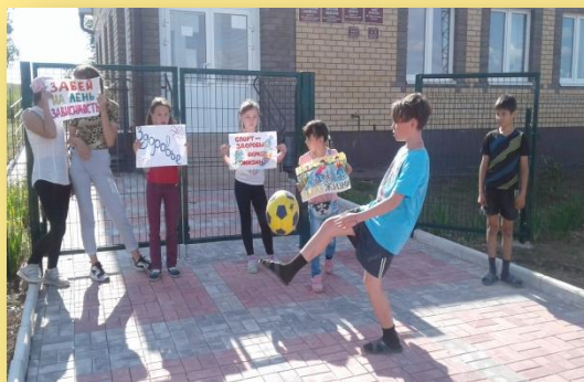
Акция «Мы выбираем ЗОЖ»