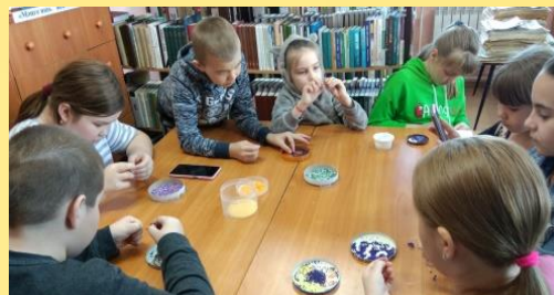
«Букет из васильков»- мастер -класс