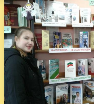
«Хвалил винца - не стало молодца»