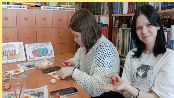
«Пасха - день святых чудес»-пасхальное мероприятие, мастер -класс