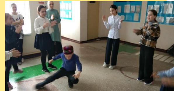
«Добро пожаловать, Науруз. Хуш килэсен, Науруз!» - театрализованное представление