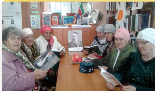
«Театр к свету ведет – озаряет» - литературный час