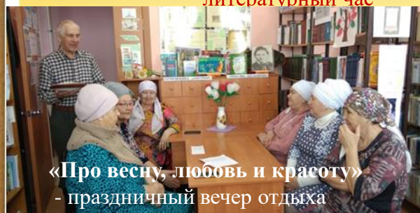
«Про весну, любовь и красоту» - праздничный вечер отдыха