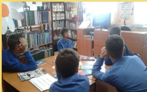
Урок – здоровья «Похититель разума»

Библиотека сегодня не только пункт выдачи книг и место проведения массовых мероприятий, но и информационно – досуговый центр для читателей разных возрастов.