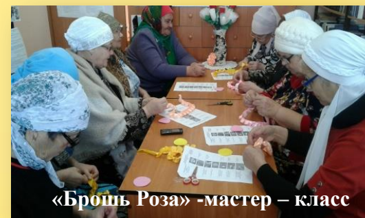
«Брошь Роза» - мастер – класс