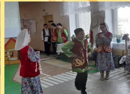
«Татар халык йолалары» - фольклорно – музыкальный вечер