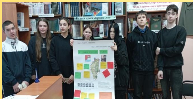
«Мы - часть страны, мы - уголок России» - краеведческий квилт