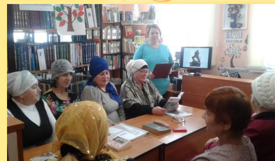
«Каһарман шагыйрь» - литературный вечер