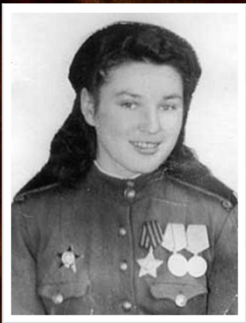
Зинаида Николаевна Александрова (1907—1983) — русская советская поэтесса и переводчица .