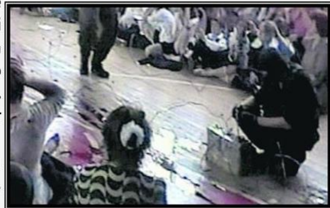
Террористы заминировали всю школу

Большинство заложников были согнаны в спортивный зал. Заставили всех сдать фото- и видеоаппаратуру, а также мобильные телефоны, которые разбивали. Снаружи школы были установлены камеры видеонаблюдения, а из «ГАЗ-66» были выгружены боеприпасы, тяжёлое вооружение и взрывчатка. Террористы забаррикадировали окна спортзала и входные двери, заминировали сам зал.