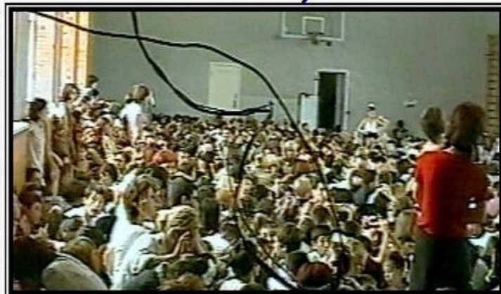
Заложники в школе в Беслане