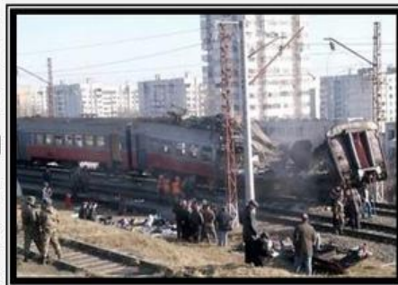
5 Декабря 2003 теракт Ессентуки

Следующий 2004 год стал пиком терроризма: в течение нескольких месяцев бандиты успели дважды подорвать московское метро, а также смертницы взорвали два пассажирских самолёта, атаковали Ингушетию и совершили несколько эффектных вылазок в самой Чечне. Эти теракты преследовали двойные цели: во-первых, запугать российский народ и лишить его воли к сопротивлению; во-вторых, разжечь пламя войны в соседних регионах. Именно ради этой цели Басаев и разработал теракт с захватом школы. Согласитесь, сложно придумать что-либо подлее, чем расправа с маленькими детьми.