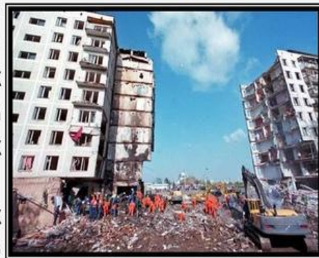
9 и 13 сентября 1999 года: взрывы жилых домов на улице Гурьянова и на Каширском шоссе.