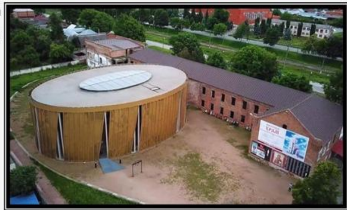
Золотой круглый саркофаг накрывает спортзал