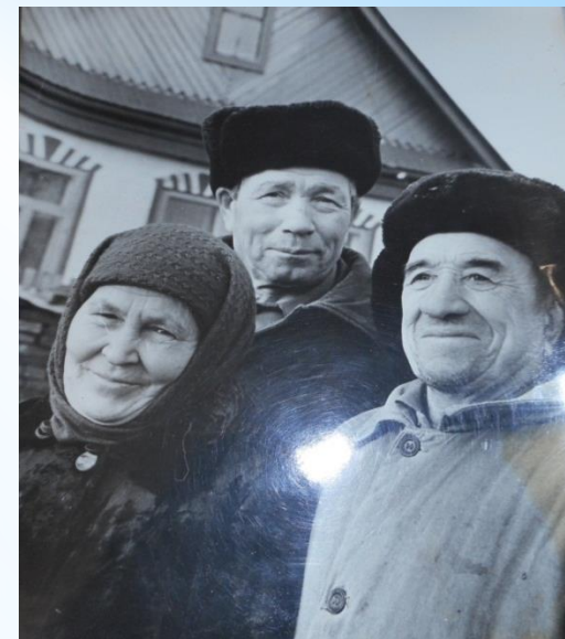
Односельчане – работники колхоза, 1970-е годы