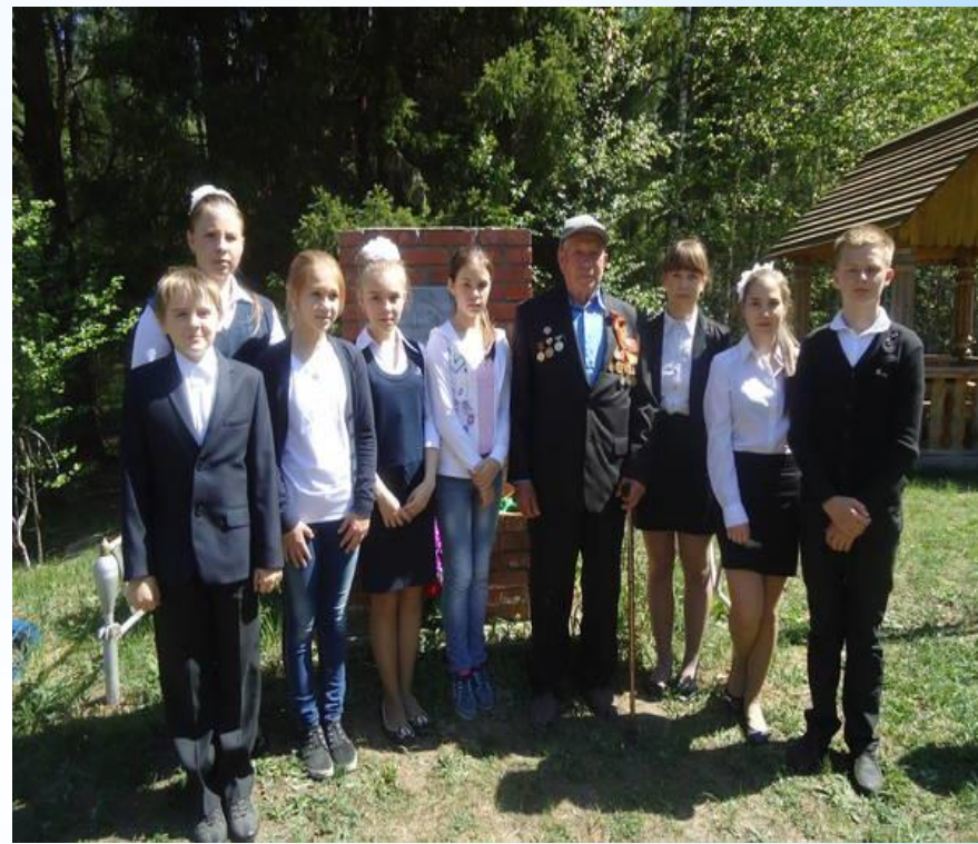
На открытии памятника в с. Суслонгер, 2014 год.