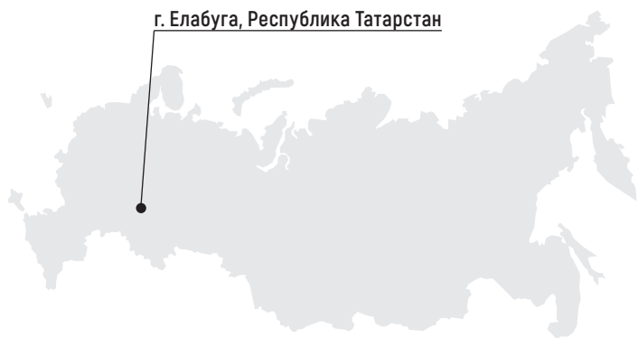
г. Елабуга, Республика Татарстан