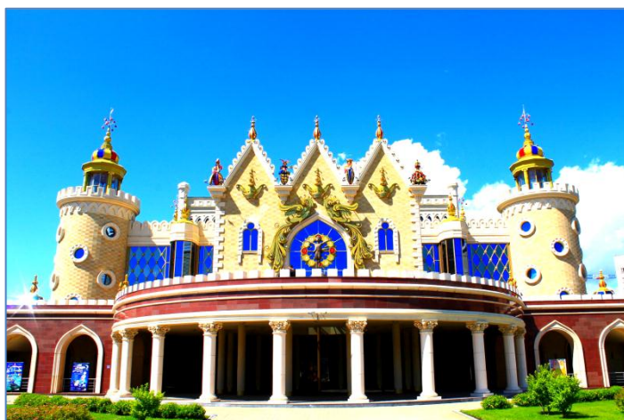
Театр кукол «Экият», г.Казань