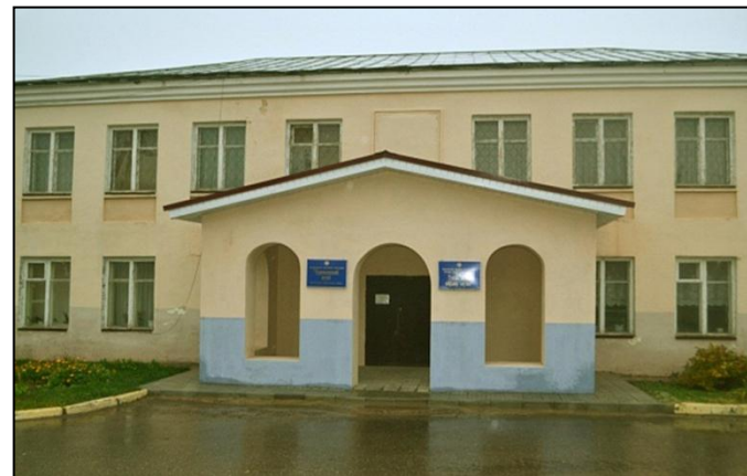
Краеведческий музей, с. Верхний Услон