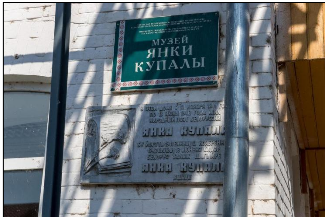
Музей Янки Купалы, с. Печищи