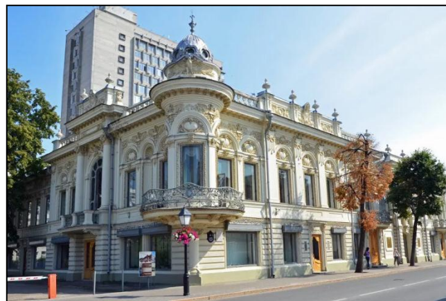
Национальная библиотека Республики Татарстан, г.Казань