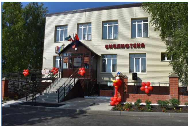
Районная библиотека, с.Верхний Услон