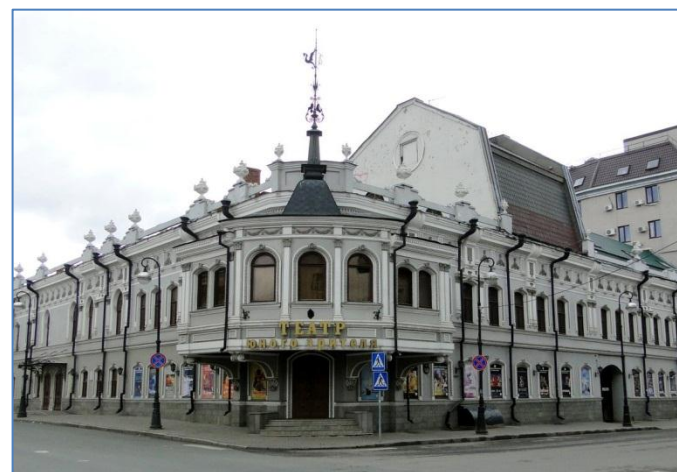
Театр юного зрителя, г.Казань