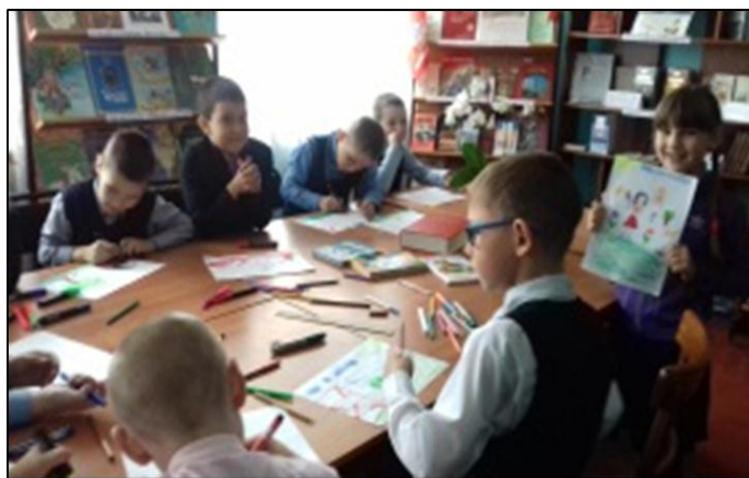
Октябрьская сельская библиотека