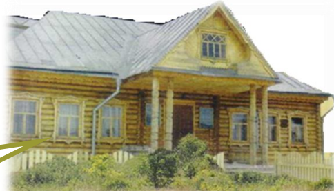
Музей Мухаммета Магдеева (открыт 13 июля 2000 г.) Адрес: д.Губурчак