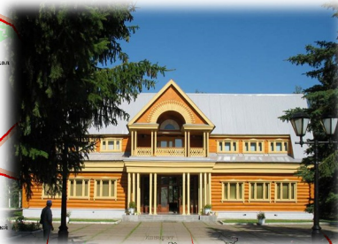
Литературно-музейный комплекс Г.Тукая (открыт в 1979 г.) Адрес: с. Новый Кырлай