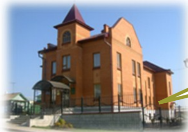
Историко-этнографический музей «Заказанье» (открыт 8 декабря 2009 г.) Адрес: г. Арск, ул. Сызгановых, 22