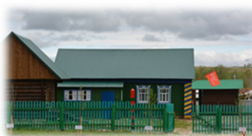
Музей-усадьба Героя Советского Союза, генерала Гани Сафиуллина (открыт 6 мая 2015 года) Адрес: д. Старый Кишит