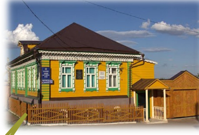
Музей литературы и искусства (открыт 26 апреля 1995 г.) Адрес: г. Арск, ул. Первомайская, д.12