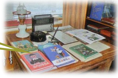
Музей «Алифба» (открыт в 2000 г.) Адрес: г. Арск, ул. Вагизовых, 14 Здание Арского педагогического колледжа им. Г.Тукая