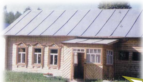
Дом-музей Тукаевых (открыт в апреле 1996 г.) Адрес: д. Кушлавуч