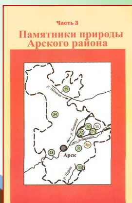
РЕКА КАЗАНКА [28]