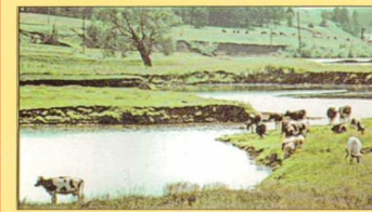
ИСТОКИ КАЗАНКИ [32]

Статус: памятник природы. Утвержден Постановлением СМ ТАССР от 19.05.72 г. N 251. Площадь: 678 га. Местоположение: Арский район РТ, Арский лесхоз, Сурнарское лесничество кв. кв. 71, 72, 83, 93, 94, 105, 114. Расположен в 18 км северо-восточнее р.п. Арска. Меры охраны: запрет рубок леса, выпаса скота, ограничение сенокосения и рубок ухода за лесом. Особая охрана крупномерных деревьев. Создание экологической тропы.