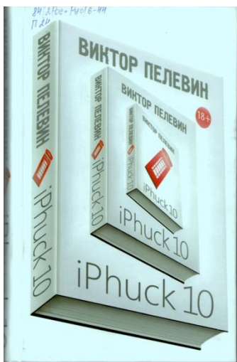
Пелевин , Виктор Олегович.

«Дебри»- историческая основа романа «Тобол». А еще и рассказ о том, как со времен Ермака до времен Петра создавались русская Сибирь. Рассказ о том, зачем Сибирь была нужна России, и какими усилиями далось покорение неведомой тайги.