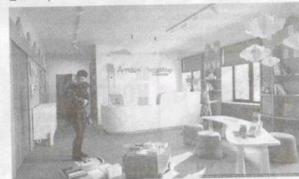
■ Булчак модельле китапханәнең дизайн-концепциясе.

лай ук яңартылган рәвештә Станислав Романовский исемдәге әдәби клуб үз ишен давам итәчак. Безгә килүче укучыларны күп кенә яңа һәм кызыклы нәрсәләр көтә. Ә без, үз чи-