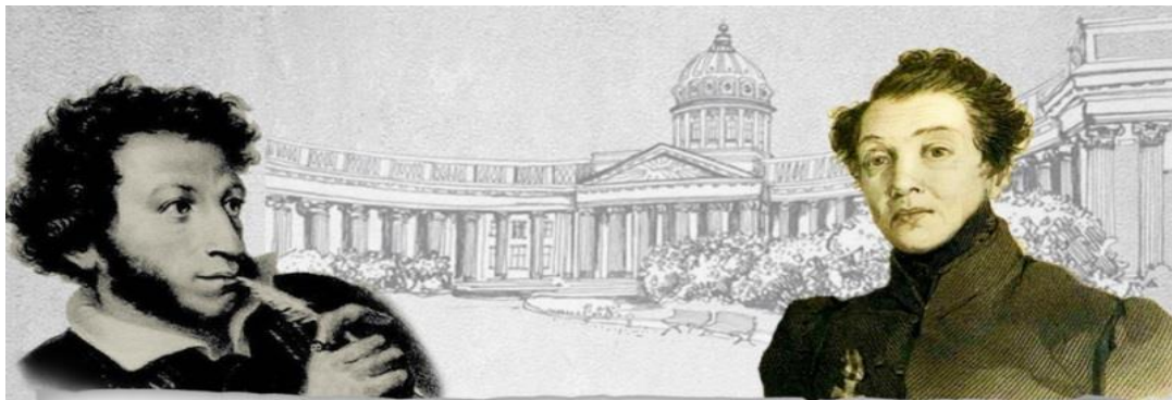
А. С. Пушкин — Н. А. Дуровой

Вот начало ваших записок. Все экземпляры уже напечатаны и теперь переплетаются. Не знаю, возможно ли будет остановить издание. Мнение мое, искреннее и беспристрастное, — оставить как есть. «Записки амазонки» как-то слишком изысканно, манерно, напоминает немецкие романы. «Записки Н. А. Дуровой» — просто, искренно и благородно. Будьте смелы — вступайте на попрание литературное столь же отважно, как и на то, которое вас прославило. Подумайте никуда не годятся. Весь ваш А. П. Дом мой к вашим услугам. На Дворцовой набережной, дом Баташева у Трачечного мосту.