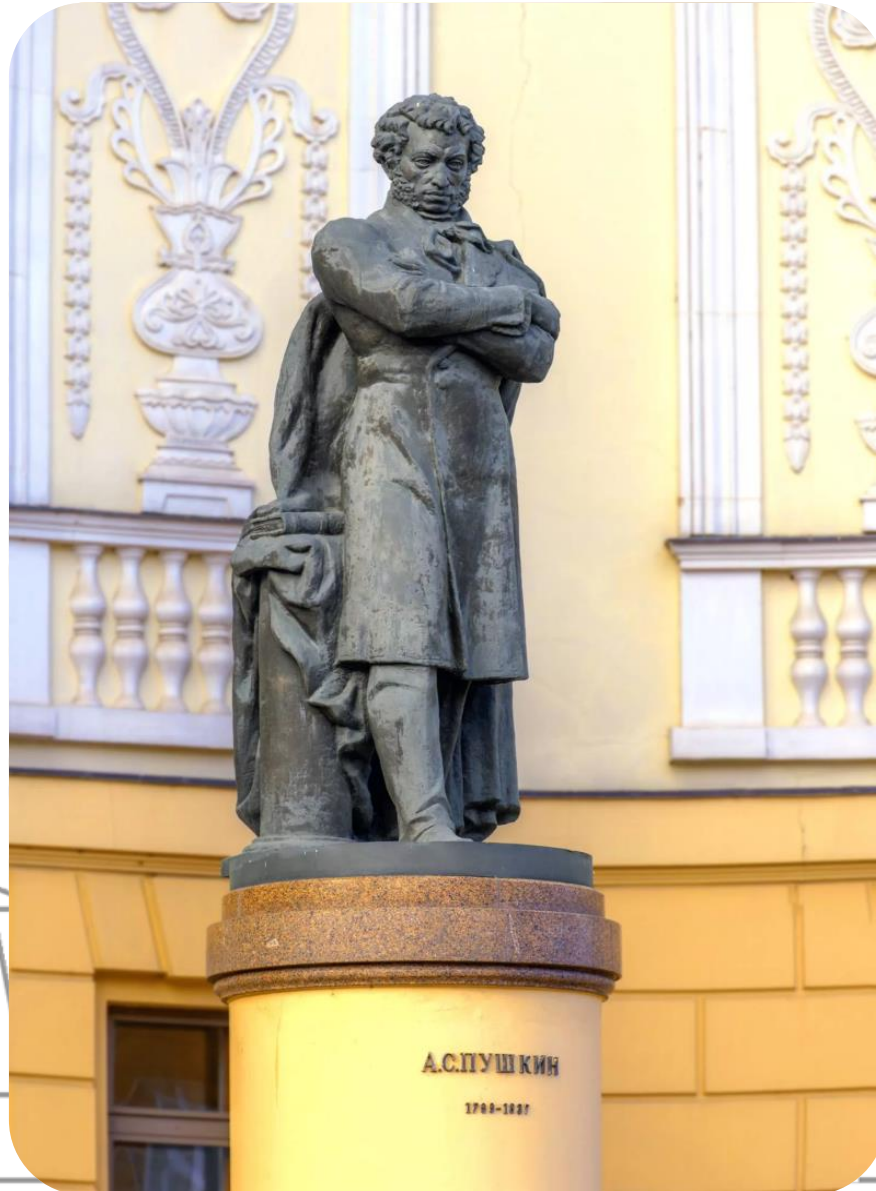
Памятник А.С.Пушкину, 1956 г., г.Казань

2023 ГОД НАЦИОНАЛЬНЫХ КУЛЬТУР И ТРАДИЦИЙ МИЛЛИ МӘДӘНИЯТЛӘР ҺӘМ ГОРЕФ-ГАДӘТЛӘР ЕЛЫ