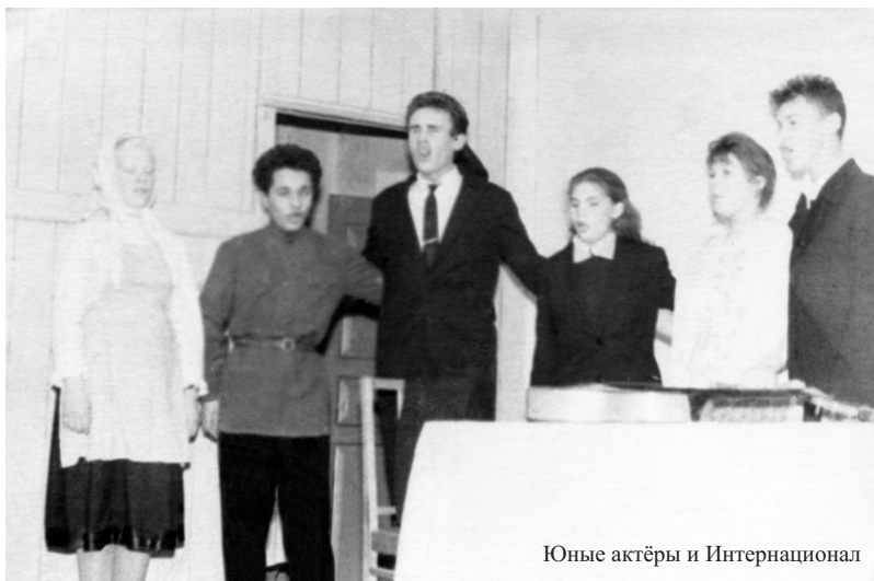
Юные актёры и Интернационал