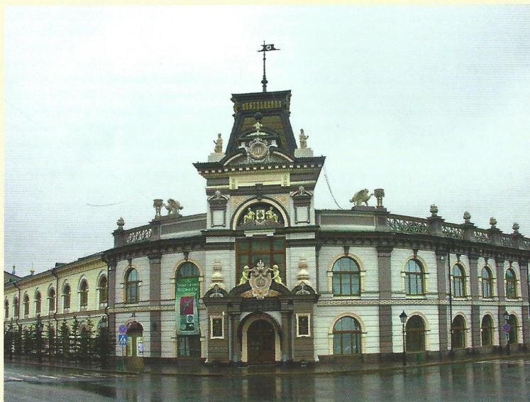
Национальный музей Республики Татарстан.