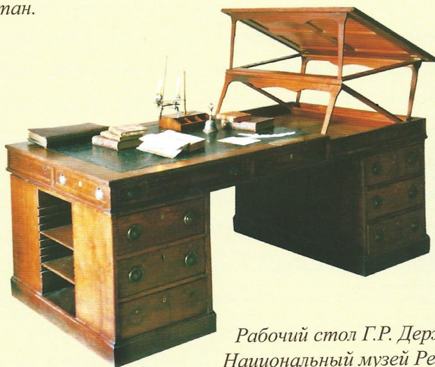
Рабочий стол Г.Р. Державина Национальный музей Республики Татарстан.

В 1934 году на основании приказа директора библиотеки Казанского государственного университета от 29 июня 1934 года за № 392 мемориальный комплекс Державина стол, кресло и чернильница были переданы в Центральный музей Татарской республики.