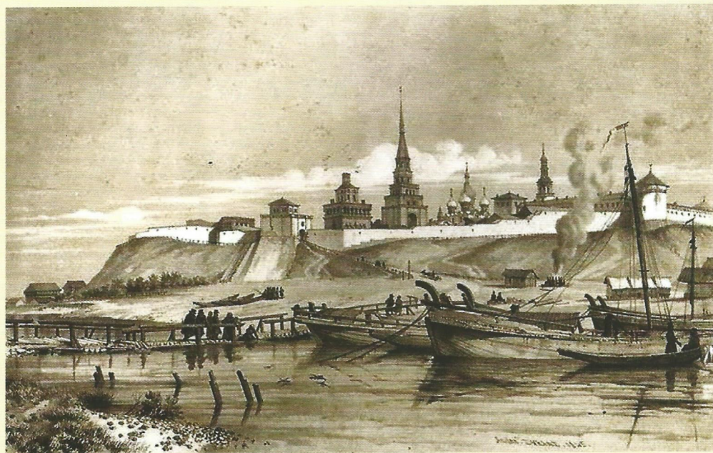
Казанский Кремль со стороны реки Казанки. Литография Э. Турнерелли. 1839 год. Национальный музей Республики Татарстан.

Гавриил Романович считал своей родиной Казань. “Казань, мой отечественный град, с лучшими училищами словесности сравнится и заслужит, как Афины, бессмертную себе славу...”, – писал Державин профессору Городчанинову, приветствуя процветание Казанского университета – третьего в России. Эти слова казанцы никогда не забудут.