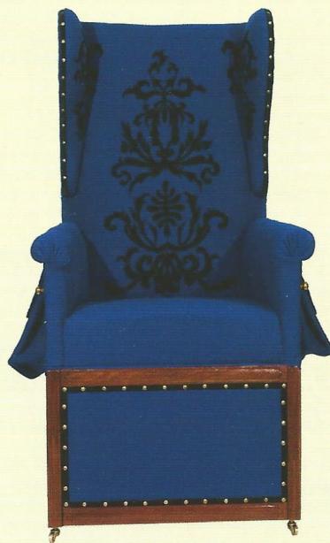
Кресло Г.Р. Державина Национальный музей Республики Татарстан.