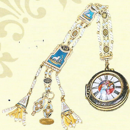
Золотые часы Г.Р. Державина Национальный музей Республики Татарстан.

В конце XIX века в 1895 году был открыт Казанский городской научно-промышленный музей, ныне Национальный музей Республики Татарстан. Уже за несколько лет до открытия в его фонды стали поступать предметы, связанные со знаменитым уроженцем Казанского края.