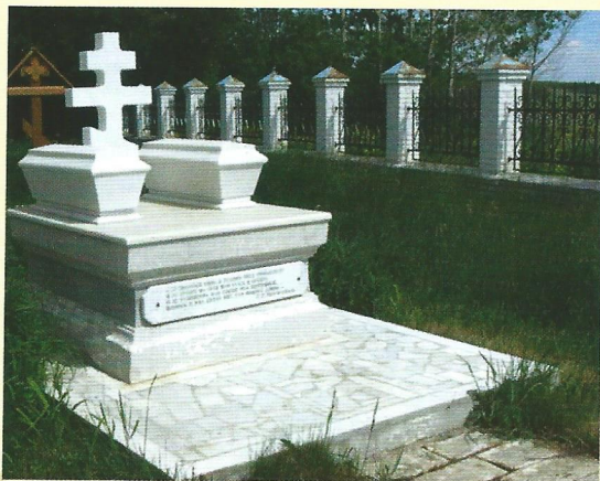
Усыпальница родителей Г.Р. Державина.

Могилы родителей Гавриила Романовича находятся в селе Егорьево, основанном в начале XVII столетия на землях Казанского Спасо-Преображенского монастыря. В 1646 году в селении были монастырский двор, дворы попа, дьячка, пономаря, 36 дворов крестьян и бобылей. Приход возник в 1639 году, когда здесь была построена деревянная церковь в честь Богоявления Господня. Двухпрестольный каменный храм построен в 1769 году. Придел был освящен именем Святителя и Чудотворца. Церковь в стиле барокко построена на средства местной помещицы Анны Федоровны Чемодуровой. Рядом с церковью находятся место упокоения Феклы Андреевны и Романа Николаевича. 30 августа 1784 года Гавриил Романович Державин просил священника села Егорьево отца Федора «о проведении Божественной заупокойной литургии по усопшим каждую неделю – в субботу, и учредить сие таким образом, чтобы эту службу продолжали навсегда, для этого получать 7 рублей доходов господских из деревни Бутыри каждый год: 5 рублей собственно для священника, а 2 – на