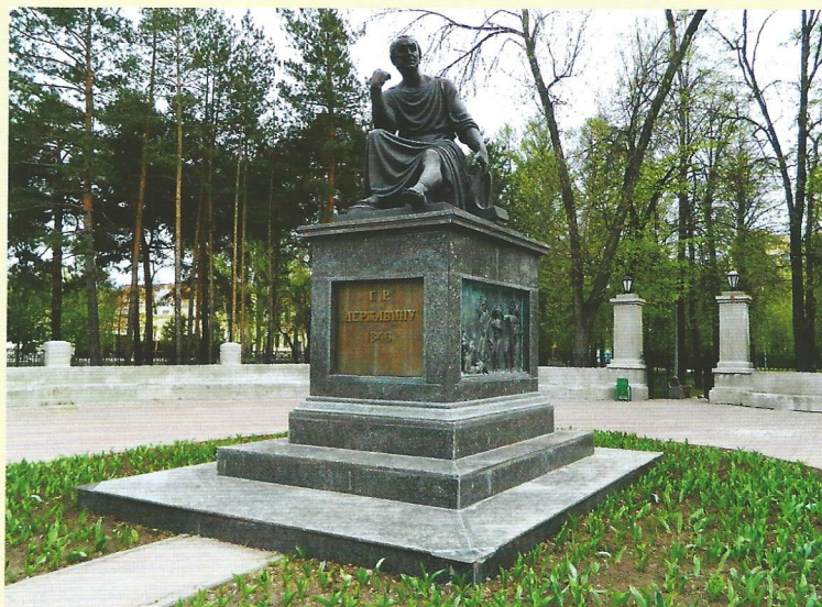
Памятник Г.Р. Державину. Казань. 2003 год

Вторую жизнь памятник обрел в 2003 году и был установлен в Лядском саду.