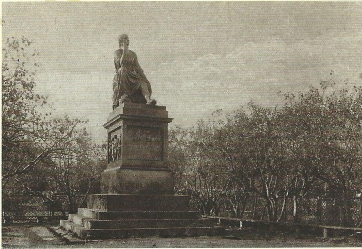
Памятник Г.Р. Державину на открытке XIX века.

Следующим шагом в сохранении памяти о знаменитом земляке стало решение о создании памятника, который бы показал «уважение России к одному из первейших ее поэтов и, с тем вместе, служил бы украшением довольно важного города в Империи, какова Казань».