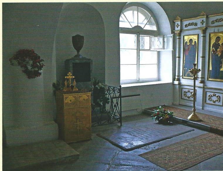
Могилы Гавриила Романовича и Дарьи Алексеевны Державиных в Богоявленском приделе Спасо-Преображенского собора.