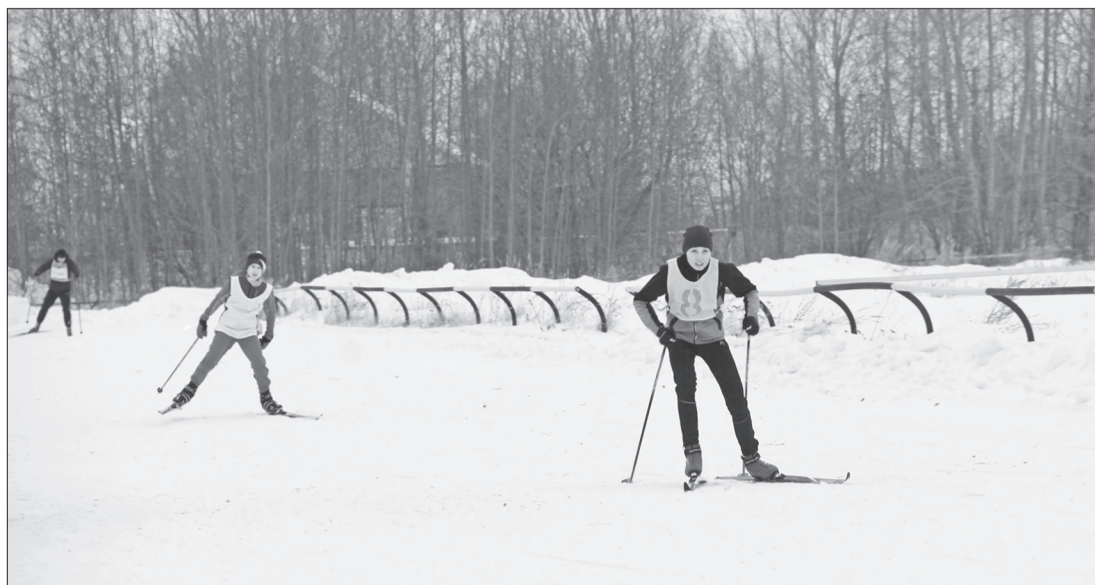
Каждый участник преодолел дистанцию в 1 км. /