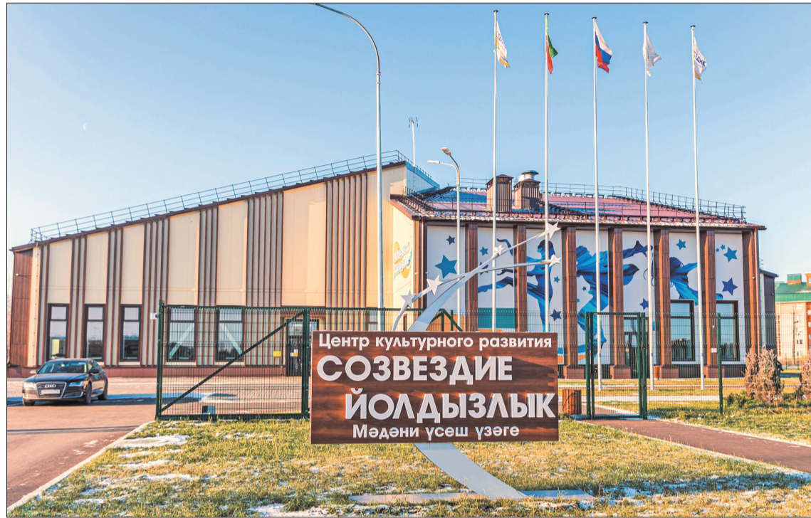
■ В 2022 году структура Управления культуры пополнилась новым учреждением – Центром культурного развития «Созвездие».

и первого экрана, в новом обновленном кинозале. Также кинотеатр стал обладателем гранта ПАО «Татнефть» с проектом «В кино на коляске», благодаря чему в этом году кинотеатр будет обустроен по современным канонам «Доступной среды». В 2022 году представительство Ассамблеи народов Елабужского муниципального района получило грант Президентского Фонда культурных инициатив, и в течение года реализовывался проект «V Этнокультурный фестиваль «Мозаика народов Дагестана». Проект детской музыкальной школы № 1 имени Энвера Бакирова «Классическая музыка для всех» получил грант Правительства РТ, благодаря которому в школе были пошиты новые костюмы для народного ансамбля «Элегия». Хочется рассказать и о других победах. Например, Хлыстовский дом культуры и Мортовская сельская библиотека стали победителями республиканского конкурса на лучшие учреждения культуры, находящиеся в сельских поселениях, и каждый получил по 100 тысяч рублей.