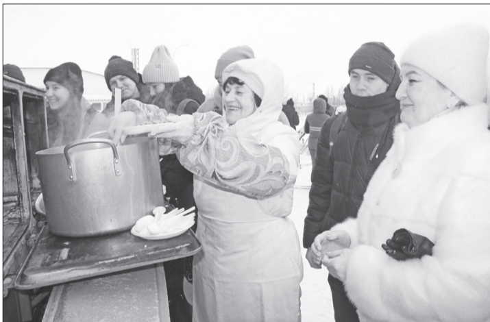
Во время мероприятия всех желающих угощали кашей и горячим чаем.

Он поприветствовал учащихся и пожелал им успехов.