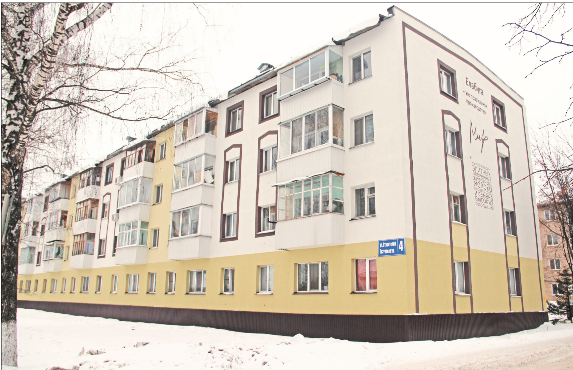
ЖКХ. Дом № 4 по улице Строителей был отремонтирован в 2022 году. / 5

Коммунальщики подводят итоги работы за год