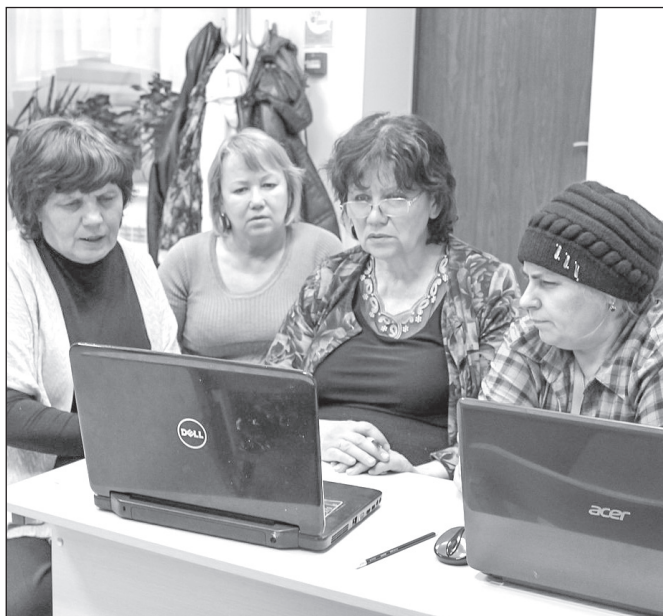
■ Новые технологии пользователи старшего поколения изучают вместе с автором статьи

Любознательным пользователям можно предложить поломать голову, разгадывая закодированные слова. В одном фильме я видела, как разведчики с помощью книги, журнала шифровали слова. В получившемся тексте были одни циф-