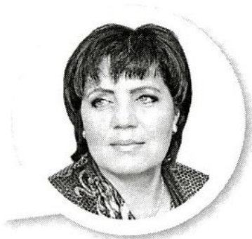
с. Костенево, Республика Татарстан